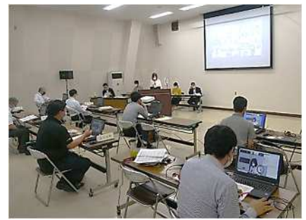
(オンラインも併用し開催した情報共有会の様子)

5月20日(木)、県社会福祉会館にて、「災害ボランティアに関する情報共有会」を開催しました。これは、災害時にボランティア活動を通じた被災者支援を効果的かつ円滑に実施することができるよう、市町の行政と社協間の相互理解を深め、連携体制の強化を図るために、県民協働課と共催で開催したもので、当日は全20市町から行政・社協の災害ボランティア担当者計56名(うち17市町49名はオンライン)の参加がありました。▶会では、県民協働課から、災害時の行政・社協(災害ボランティアセンター(以下「災害VC」))・災害ボランティア団体等の協働の重要性や被災者支援の調整におけるポイント等を、本会から災害VCの役割と機能等について説明しました。また、災害時に活動を希望される災害ボランティア団体等の調整役としての役割が期待される佐賀災害支援プラットフォーム(SPF)から活動について報告いただきました。▶今後も、平常時の市町社協に対する情報提供や体制整備の支援等を通じ、災害時に迅速かつ効果的に災害VCの設置運営ができるよう取り組みを推進していきます。