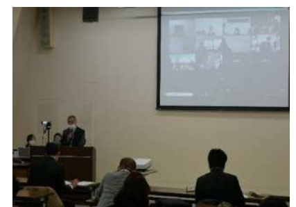
（オンラインの参加者とも意見交換を行う様子）

1月29日(金)、県社会福祉会館にて「災害ボランティアセンター（以下「災害VC」）費用等に係る市町行政の災害ボランティア担当及び市町社協担当情報共有会」を開催し、全20市町（うち10市町はオンライン）から計56名に参加いただきました。▶この情報共有会は、令和2年7月から災害VCの費用（人件費・旅費）の一部が災害救助法に基づく国庫負担の対象となったことを受け、県民協働課との共催により開催したものです。研修会では、まず本会から市町災害VCの実際の運営について説明した後、県民協働課職員から平時のうちに災害VCの役割や国庫負担となる費用等を理解しておくことの重要性や、発災後に必要となる具体的な手続き等について説明を行いました。▶今後も、市町社協が、発災後に迅速に災害VCの設置運営ができるよう、行政と社協を対象とした会議や説明会の開催等を通じて、より一層被災者支援を強化していきます。