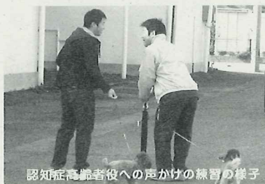
認知症高齢者役への声かけの練習の様子

吉野ヶ里町社会福祉協議会では、認知症高齢者の「早期発見・早期治療」に向けて、これまで開催していた認知症予防教室と並行して地域住民への啓発のための「認知症見守り隊養成講座」を実施されています。この講座の参加者(延べ600人)のうち、見守り隊メーリングリストへは修了者を中心に150人が登録されており、認知症に関わる情報の提供や講座の開催案内のほか、実際に捜索事例が生じた場合の情報提供などに活用されます。