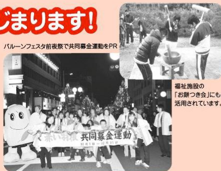
パルーンフェスタ前夜祭で共同募金運動をPR

なお、「NHK歳末たすけあい」の一環として、今年も次の催しを開催いたしますので、皆様のご来場をお待ちしております。